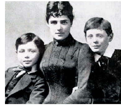
Jack Churchill (links) naast moeder Jennie en broer Winston

Wenig mensen zijn belangrijker geweest voor Winston Churchill dan zijn vijf jaar jongere broertje Jack. Ze deelden een kamer op kostschool Harrow, waren beiden in Zuid-Afrika tijdens de Boer War, en wisselden strijdnieuws uit tijdens de Eerste Wereldoorlog – toen Winston minister van Marine was en Jack militair. Ze trouwden allebei in de zomer van 1908, kregen hun eerste kind beiden in 1909, gingen samen met vakantie in Zuid-Europa en Noord-Amerika. En toen Jack stierf, in 1947, stond Winston droevig naast diens bed.